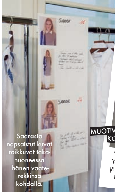
Saarasta napsaistut kuvat roikkuvat takahuoneessa hänen vaate-rekkinsä kohdalla.