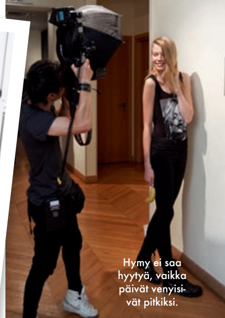
Hymy ei saa hyytyä, vaikka päivät venyisivät pitkiä.

"Sain avata Rodarten näyttöksen New Yorkissa. Tärisin kauttaaltaan ennen ja jälkeen näytöstä sekä lavalla. Yleisössä istuivat Anna Wintour ja Beyoncé."