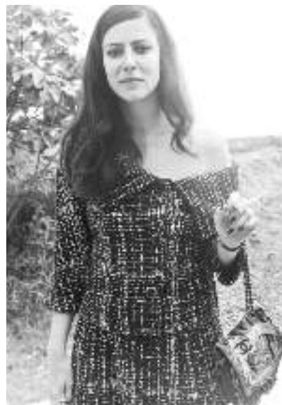
Tuomaristossa istui myös näyttelijätär Anna Mougallis, joka näytteli Coco Chanelia elokuvassa Coco Chanel & Igor Stravinsky . Vuonna 2002 hän antoi kasvonsa Allure-parfyymille. Oikealla: Chanel oli Hyèresin festivaalin juhluvuoden pääyhteistyökumppani. Se näkyi muun muassa Villa Noailles -taidekeskuksen näyttelyissä, joissa esiteltiin muotitalon luomuksia ja Karl Lagerfeldin valokuvia.