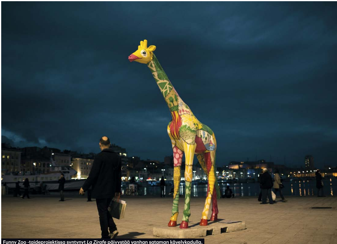
Funny Zoo -taideprojektissa syntynyt La Zirafe päivystää vanhan sataman kävelykadulla.

OPAS KAUNIISEEN ELÄMÄÄN | MATKA | RUOKA & JUOMA | TYYLI & DESIGN