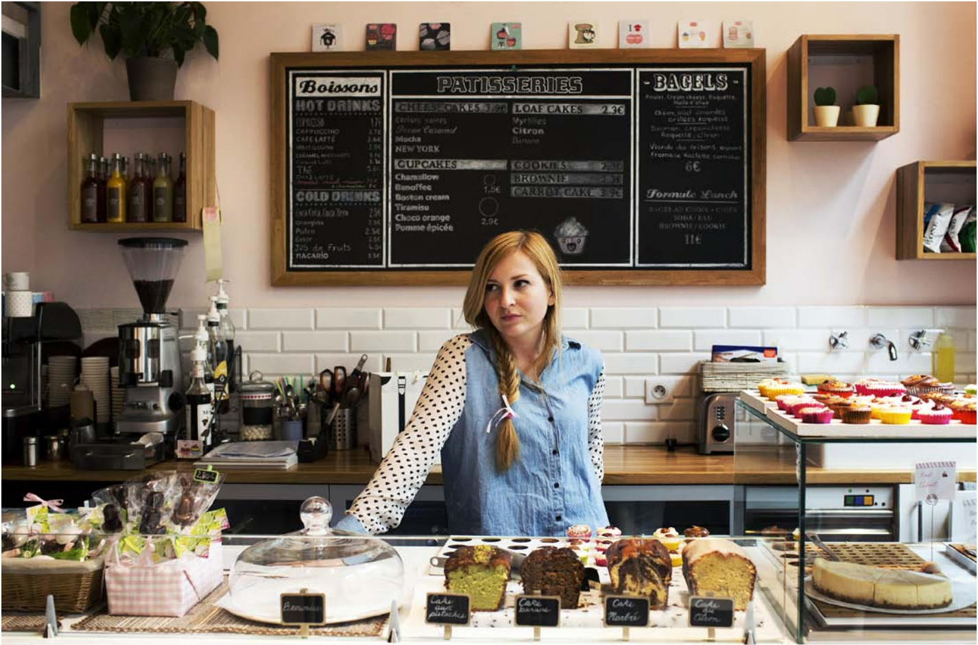
Flora Monarcha tarjoilee amerikkalaistyyllisiä leivonnaisia Minoofi-kahvilassa.