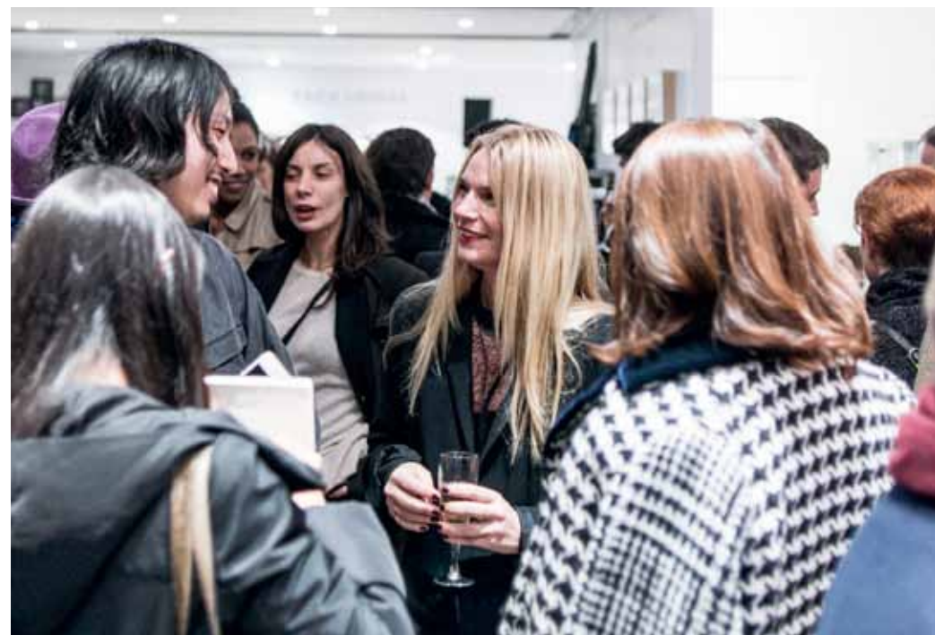
Each x Other tekee yhteistyötä taiteilijoiden kanssa, jotka kustomoivat merkin perusmallistoja: yksi käyttää vaatteeseen samaa materiaalia kuin teoksiinsa, toisen runo painetaan takkiin.

Jennyn kaksi vuotta sitten Ilanin kanssa paperille rustaamat korkeat, jopa hullut, tavoitteet ovat toteutumassa. Each x Otherilla on nyt 400 myyntipaikkaa Aasiassa, Venä-